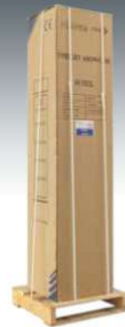
IMBALLO PER LA SPEDIZIONE SHIPPING PACKAGING