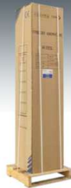
IMBALLO PER LA SPEDIZIONE SHIPPING PACKAGING